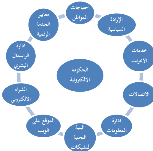
الشكل 02: متطلبات إرساء الحكومة الإلكترونية